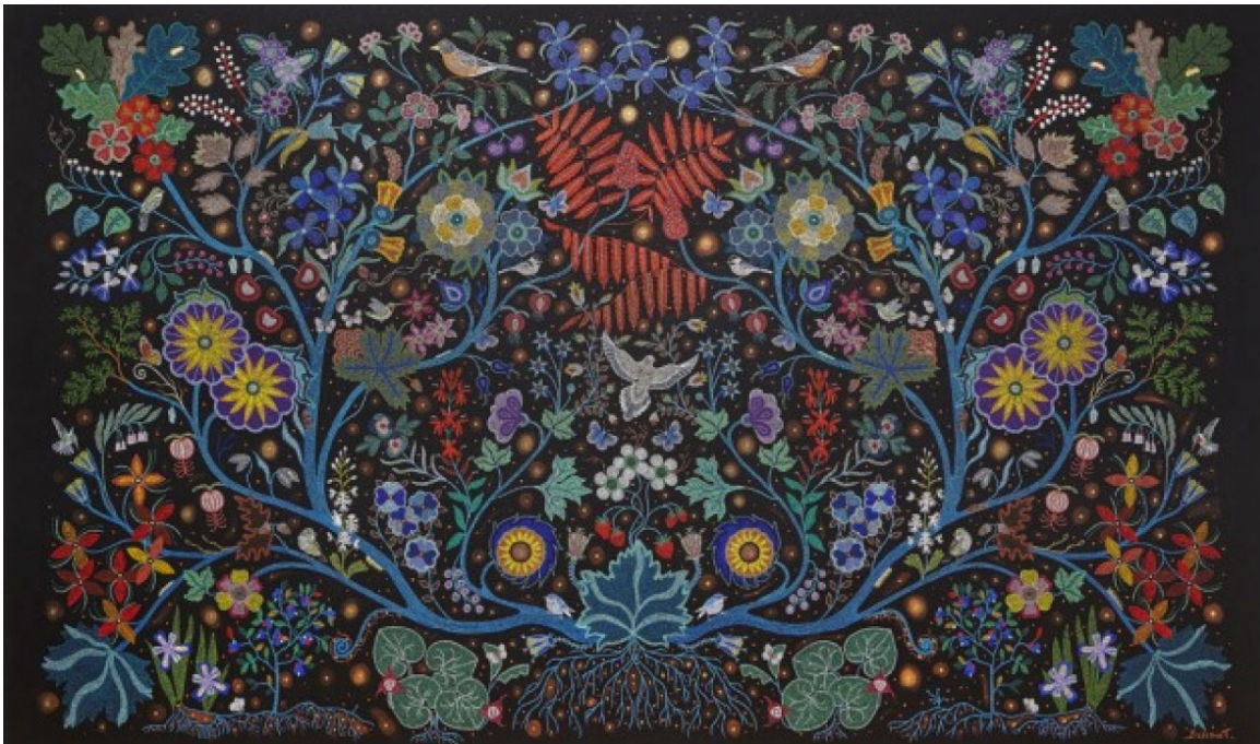
Sagesse de l'Univers : Christi Belcourt

Le concept de la promotion de la vie offre à la collectivité l'occasion d'équilibrer et de mobiliser les paradigmes actuels de prévention du suicide vers des approches exhaustives, holistiques et fondées sur la force. La promotion de la vie est fondée sur les lois naturelles reflétant la sagesse et le cercle des systèmes de savoirs traditionnels autochtones.